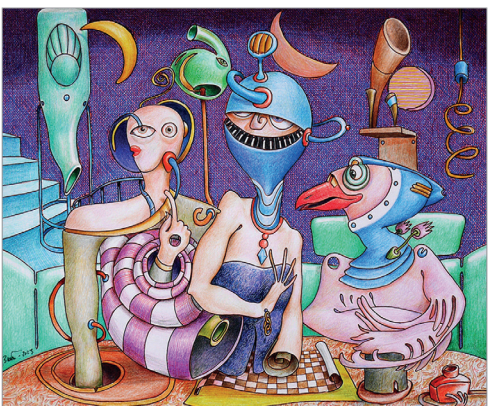
Unheilige Dreifaltigkeit, Jörg Baltes

WEITERE INFORMATIONEN: www.joerg-baltes.de www.sebastian-unterrainer.de